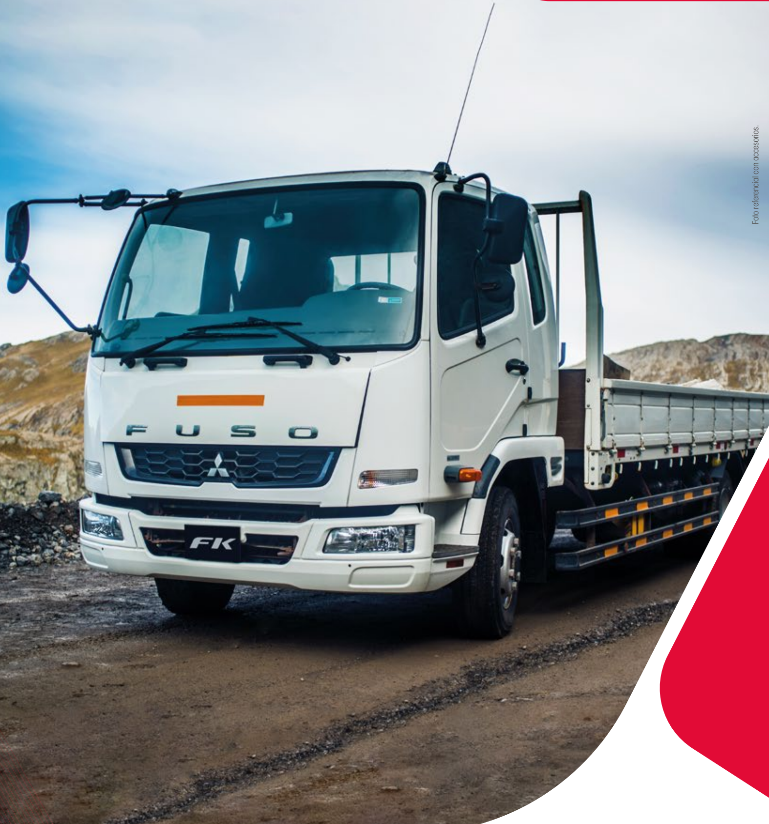
Foto referencial con accesorios.