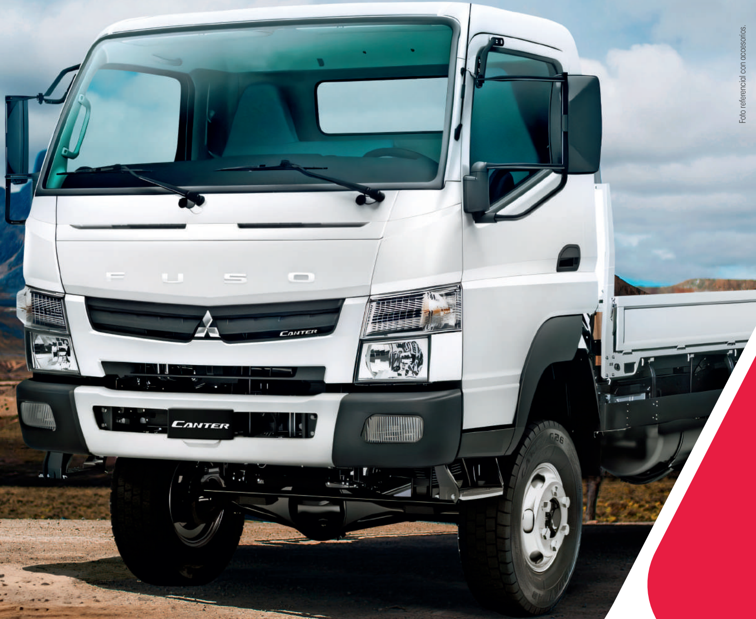
Foto referencial con accesorios.